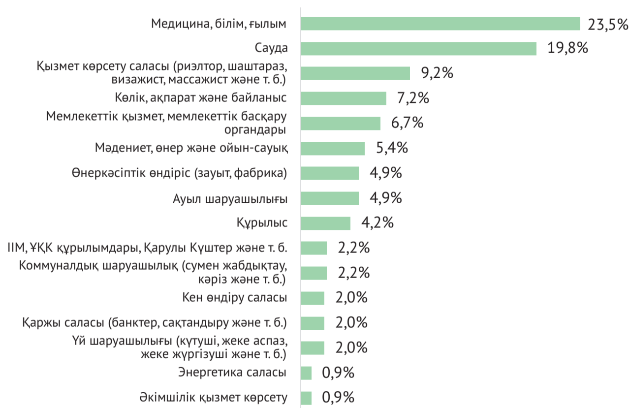
2-сурет. Сіз қай салада жұмыс істейсіз?

Көбінесе қазақстандықтар медицина, білім және мәдениет саласында жұмыс істейді. Бұл салаларды респонденттердің 23,5% өз жауаптарында таңдаған. Жұмыс істейтін әрбір бесінші қазақстандық сауда саласында жұмыс істейді. Басқа салалардың әрқайсысындағы қазақстандықтардың үлесі 10%-дан аспайды. Бұлардың ішіндегі ең басымы қызмет көрсету саласы - респонденттердің 9,2%-ы жұмыс істейді. Ал, мысалы, үйде күтуші ретінде, жеке аспазшылар және т.б. респонденттердің 2%-ы, әдетте, жас және, керісінше, зейнет жасындағы жұмыспен қамтылған.