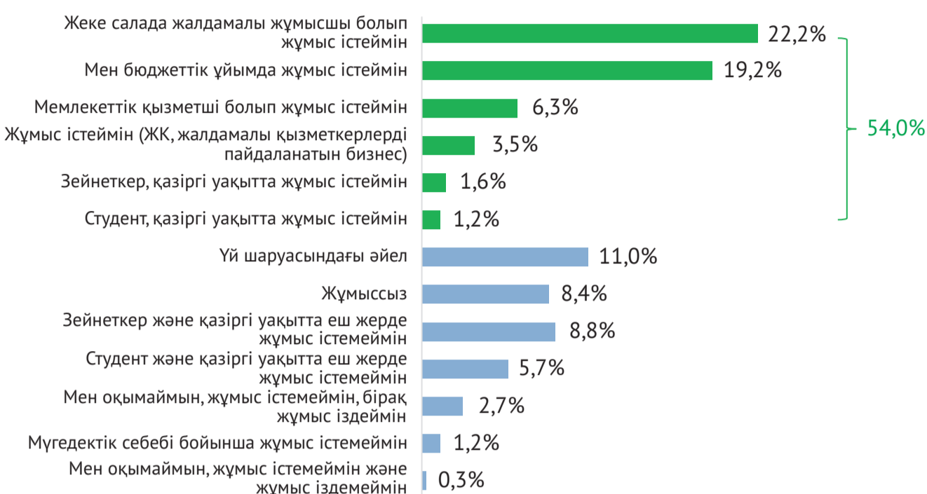
1-сурет. Сіз қазіргі уақытта немен айналысасыз?

Біздің қоғамда жұмыс істейтін зейнеткерлердің (1,6%) және студенттердің (1,2%) үлесі шамалы.